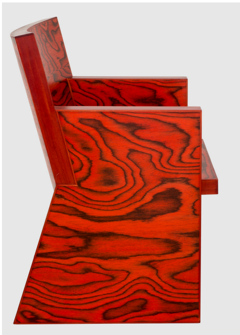
Ettore Sottsass, fauteuil In Praise of Epicurus 56 par 61 cm, hauteur 86 cm, bois d'Alpi teinté

Quant au fauteuil In Praise of Epicurus, c'est un véritable manifeste du génie d'Ettore Sottsass : en bois d'Alpi teinté à l'aniline, son original trompe-l'œil noir sur fond teinté rouge a été réalisé en 1987 par l'ébéniste Renzo Brugela et édité par la galerie new-yorkaise Blum Helman.