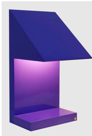
Ettore Sottsass, lampe Twenty Seven 20 par 19 cm, hauteur 41 cm, métal laqué