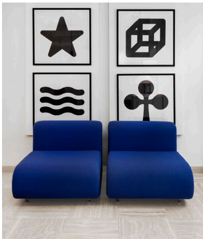
Kazuhide Takahama, Suzanne Lounge collection fauteuils rembourrés et acier chromé poli, 75 par 86 cm, hauteur 66 cm. Enzo Mari, 4 des 6 sérigraphies Simboli sinsemantici, 68 par 68 cm

Issus de la collection Suzanne Lounge, ces fauteuils très confortables aux formes organiques sont disponibles par paire, en noir ou en bleu de France, avec piètement en acier chromé poli. Ils ont été conçus par Kazuhide Takahama (1930 – 2010), designer architecte japonais, actif en Italie depuis 1957 et édités en 1965 par Dino Gavina, un des plus grands éditeurs de design en Italie.