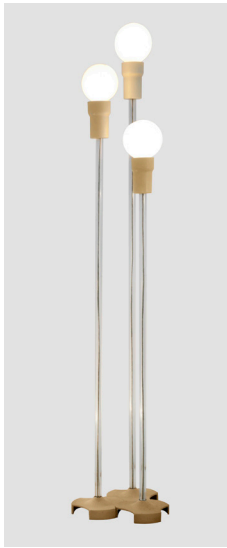
Gino Sarfatti, lampadaire n°1073/nt hauteurs de 130, 150 et 160 cm, méthacrylate et métal peint