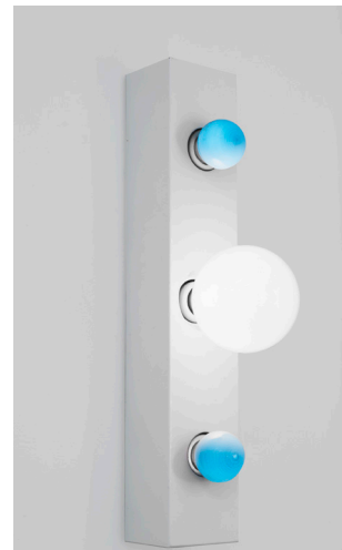
Ettore Sottsass, applique Twenty One 8 par 9 cm, hauteur 44 cm, métal laqué, ampoule centrale Ø 95 mm, ampoules latérales Ø 45 mm

La Galerie Christine Diegoni est ouverte du mardi au samedi de 14 h à 19 heures.