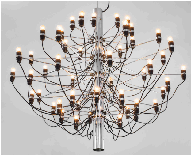
Gino Sarfatti, lustre n°2097/50 diamètre 100 cm, hauteur 87 cm, métal chromé et bakélite

A l'issue de la Fiac et en parallèle des Puces du Design, la Galerie Christine Diegoni expose une sélection de pièces uniques, des fauteuils sculpturaux et des luminaires iconiques conçus par des designers italiens qui à partir des années 60 ont anticipé les interactions entre art et design.